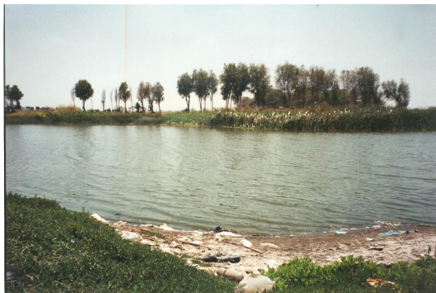
Laguna La Pava de Mochumí

De esta forma se beneficiaron 17 familias que no contaban con agua cerca de sus viviendas. Beneficiarios indirectos: 102 personas.