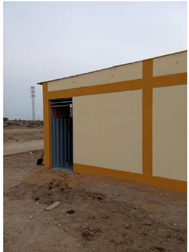
Das neue Gebäude im Rohbau